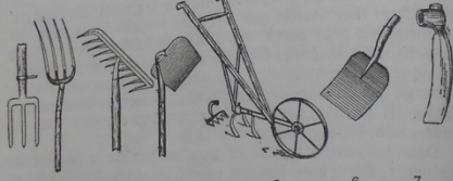
1 Trident 2 Fourche 3 Râteau 4 Râteau à tirer 5 Houe à bras 6 Pelle plate à arracher 7 Pioche

1. Bêche à dents, trident. Elle remplace la bêche plate et coupante du jardinier-maralcher; les trois dents à section triangulaire ou ovale, légèrement pointues, n'ont que 20 à 22 centimètres. La douille peut être